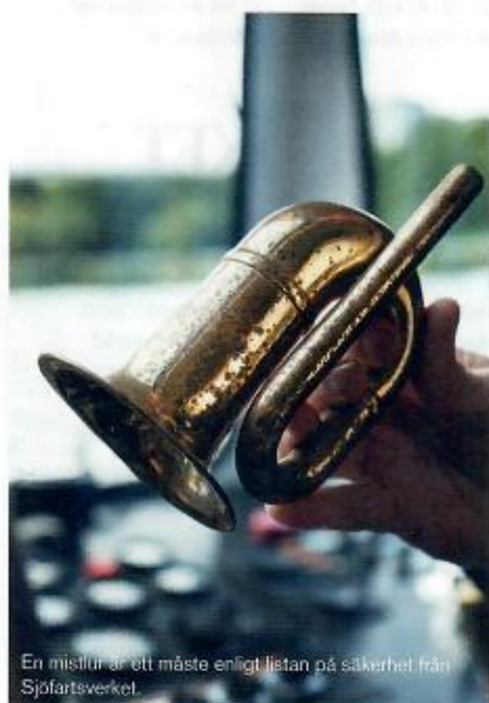
En mistlur är ett måste enligt listan på säkerhet från Sjöfartsverket.

in i sundet under Nackanäsbron som skiljer Järlasjön från Sicklasjön.